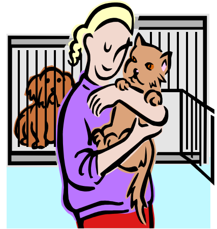
Un gatto che ha finalmente trovato la sua padrona